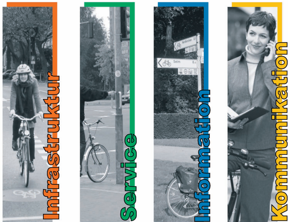
Abb. 2-1: Die 4 Säulen der Radverkehrsförderung

In den 70er und 80er Jahren standen mit dem Bau von Radverkehrsanlagen primär infrastrukturelle Maßnahmen im Vordergrund der Arbeiten. Ende der 90er Jahre fand ein Wandel in der Radverkehrsförderung statt: Mit dem Planungsansatz „Radverkehr als System“ wurde dokumentiert, dass die vier Säulen Infrastruktur, Service, Information und Kommunikation gleichwertige Komponenten der Radverkehrsförderung sind.