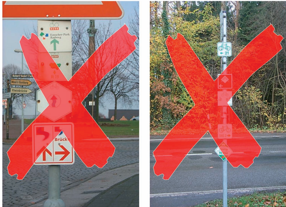
Abb. 2-2: Ungewollte Vielfalt unterschiedlicher Themenroutenschilder an einem Pfosten